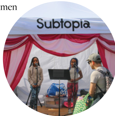
I Subtopias tält på Vi är Botkyrka kunde man bland annat sjunga karaoke.

Subtopia är en plats för kulturproduktion, upplevelser och möten som ligger i Alby. Vi möjliggör kulturell och samhällsbyggande kulturproduktion på alla nivåer, såväl ideellt som kommersiellt. Här finns ett kluster av kulturföretag, 15000 kvm funktionella utrymmen för kultur och gedigen kunskap inom cirkus, film, urban konst, entreprenörskap, ungdomsverksamhet och events.