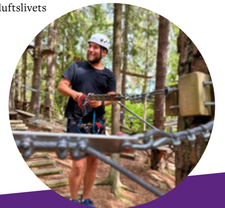
Accropark Höghöjdsbana för den äventyrliga besökaren.

Accropark Höghöjdsbana öppnade för säsongen under sportlovet och erbjöd svindlande äventyr ända in i november. Trots något minskade besöksiffror uppe bland träden, i jämförelse med året innan, ser vi att höghöjdsbanan fortsätter vara uppskattad av många besökare.