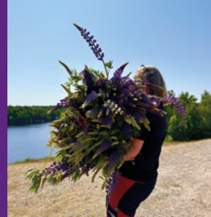
Bukett av lupiner från skidbacken.