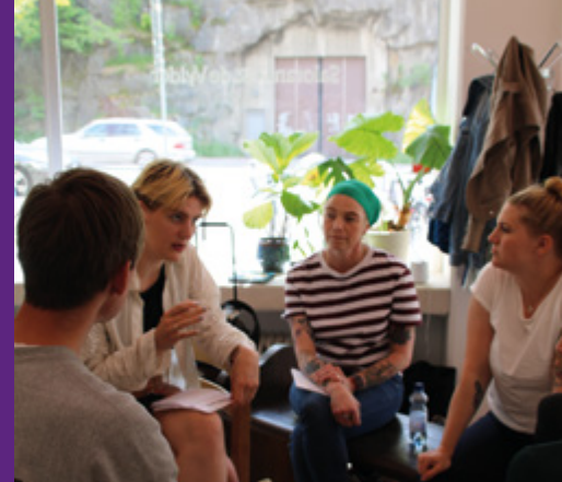
Utvärdering av festivalen CirkusMania 2023.