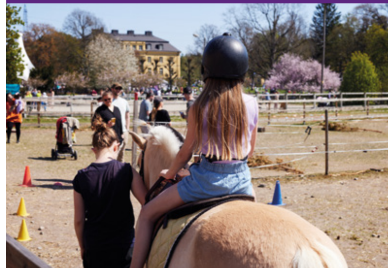
Ponnyridningen på Folkparksfesten var populär.

70 engagerade föreningar och organisationer