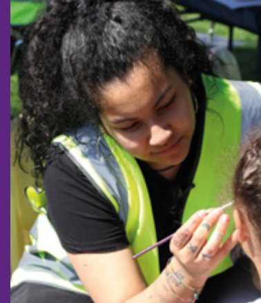
Ansiktsmålning i Subtopias tält under Folkparksfesten i Hågelby.