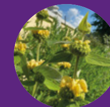
Den ståtliga perennen Gul lejonsvans i Hågelbyparken.