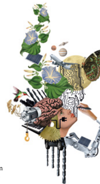
För konferensen Cross Con beställdes en specialdesignad illustration av Sofia Scheutz.

Under 2023 har vi utvecklat våra metoder för uppföljning och analys med vidareutbildning i Google Analytics 4 och en struktur för återkommande uppföljning av digitala kanaler. Vi har även finslipat vår mötesstruktur med syftet att skapa tydlighet och mer insyn för alla på avdelningen.