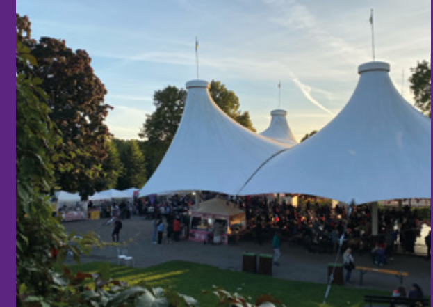
Chilenskt nationaldagsfirande på dansbanan i Hågelbyparken.