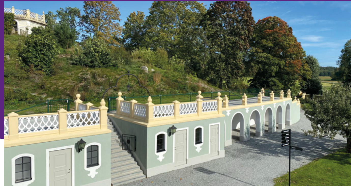
Orangeriet med nya offentliga toaletter är färdigrenoverat.