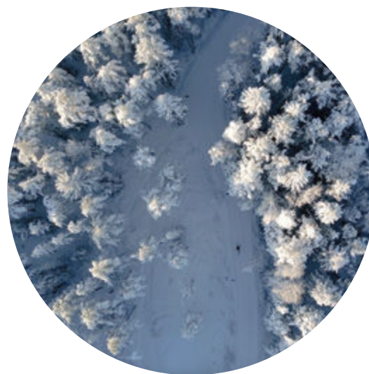
Vy ovanifrån över skidspår.

Det totala besökantalet på arrangerade event ligger på ungefär samma nivå som 2022, vilket fortfarande är mindre än åren innan restriktionerna.