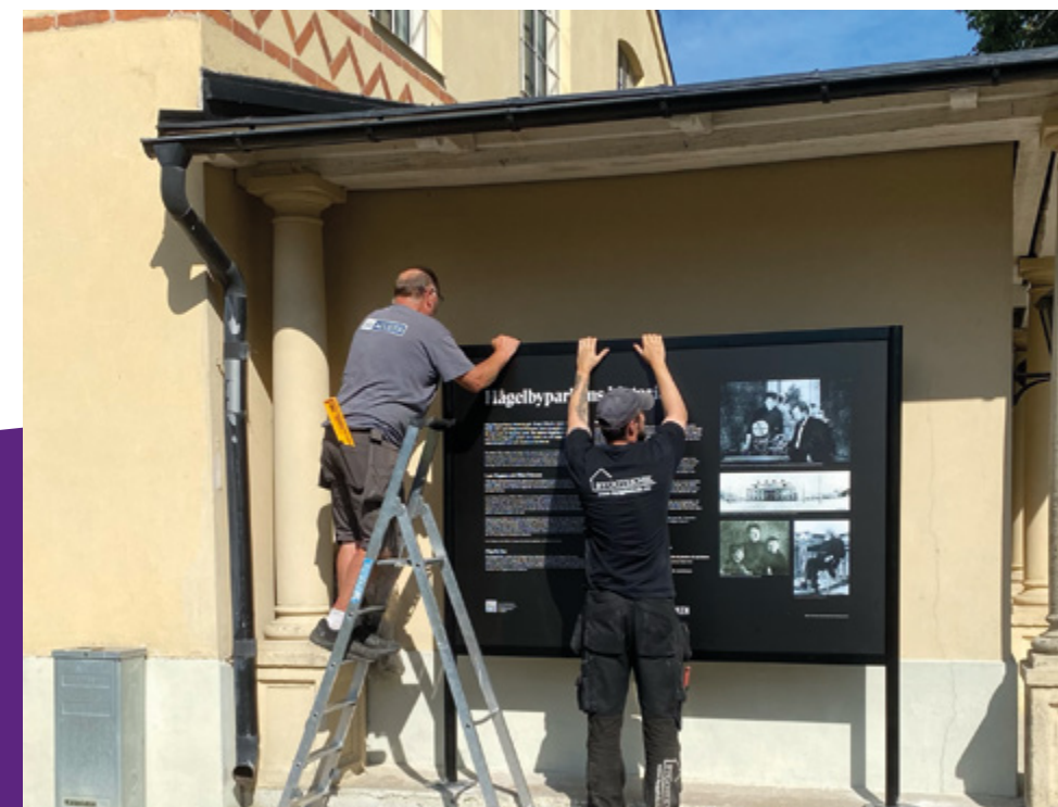
Under 2023 satte vi upp flera historiska skyltar runt om i parken.

Under året har vi monterat flera historiska skyltar runt om i parken, vilka snabbt har uppmärksammats av besökarna.