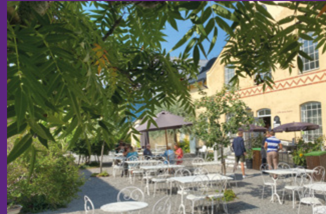
Café Anna Giertz serverar lunch och fika året runt.