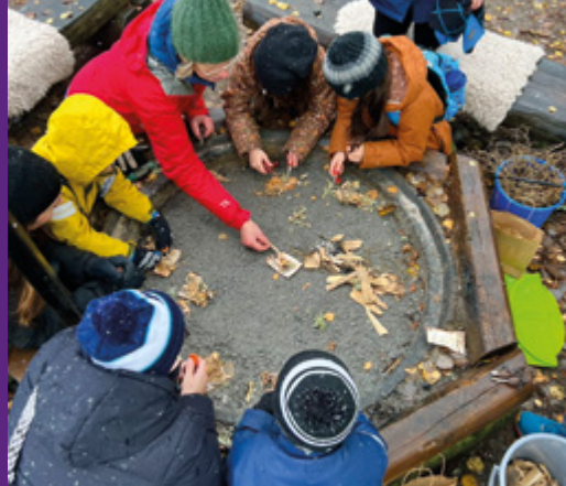
Eldkurs för både barn och vuxna under höstlovet.