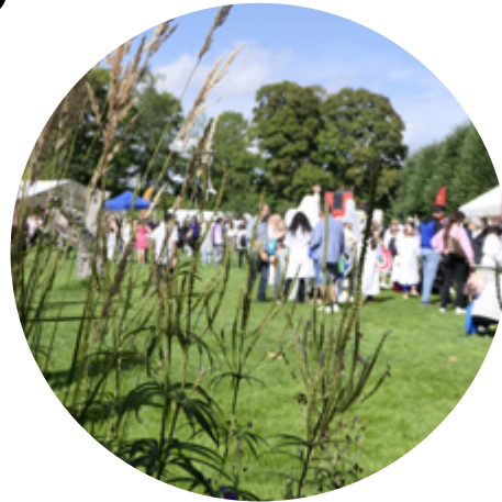
Festivalen Vi är Botkyrka arrangeras varje år tillsammans med Botkyrka kommun.

Styrelsen och verkställande direktören för Upplev Botkyrka AB (556767-7876), med säte i Tumba, får härmed avge förvaltningsberättelse för räkenskapsåret 2023-01-01 – 2023-12-31