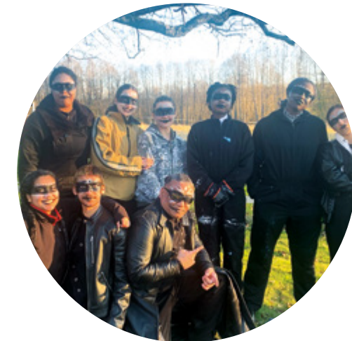
Subtopias ungdomsverksamhet Do It Together uppträdde på Hagelbyparkens valborgsfirande.