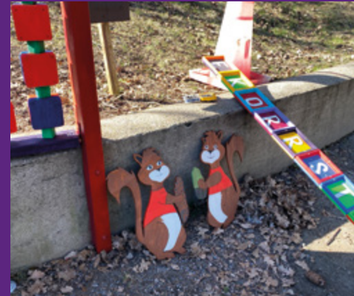
Daglig verksamhet har skapat flera nya detaljer till ekorrstigen.