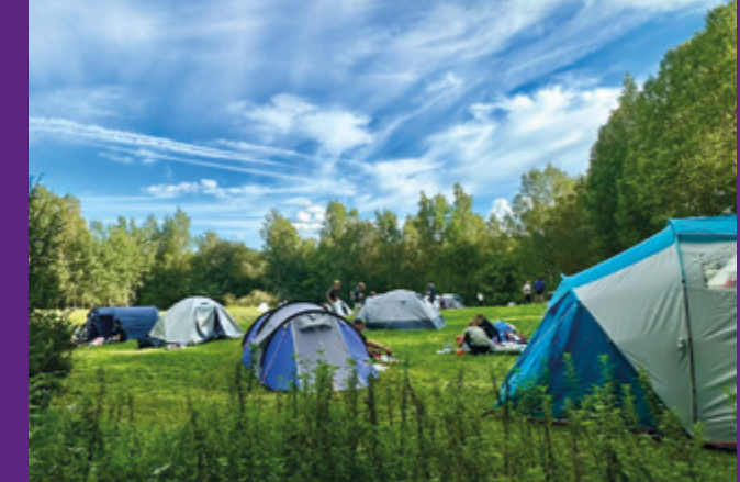
Många klasser väljer att tälta på Lida.