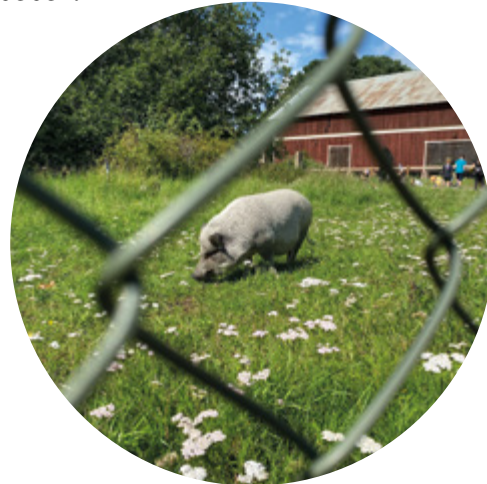
Grisarna hos Hågelby 4H.

Årets nyhet var Folkparksfesten som vi arrangerade i maj tillsammans med flera lokala aktörer. Vi firade som vanligt flera olika högtider, dansade, skrattade till barnteater och bjöd in till andra roliga aktiviteter. Vår stora park fylldes med mycket kul.