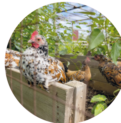
Hönsen på Hagelby 4H är mysiga att gosa med.