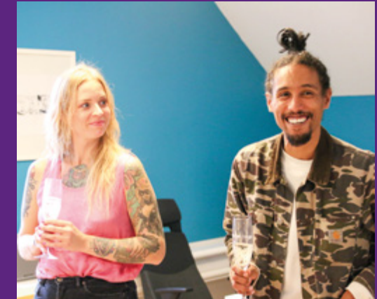
Kick-off för medlemmarna i Subtopias inkubator Katapult.