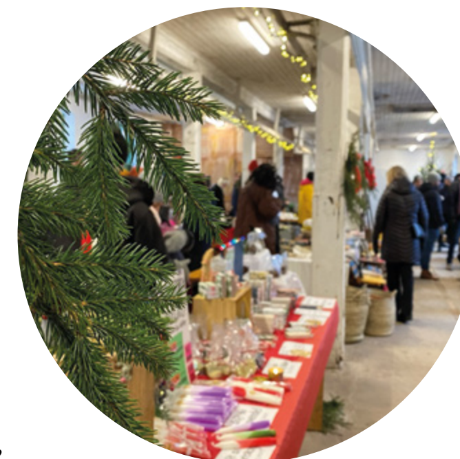
I år var julmarknaden inomhus i parkens stora stall.