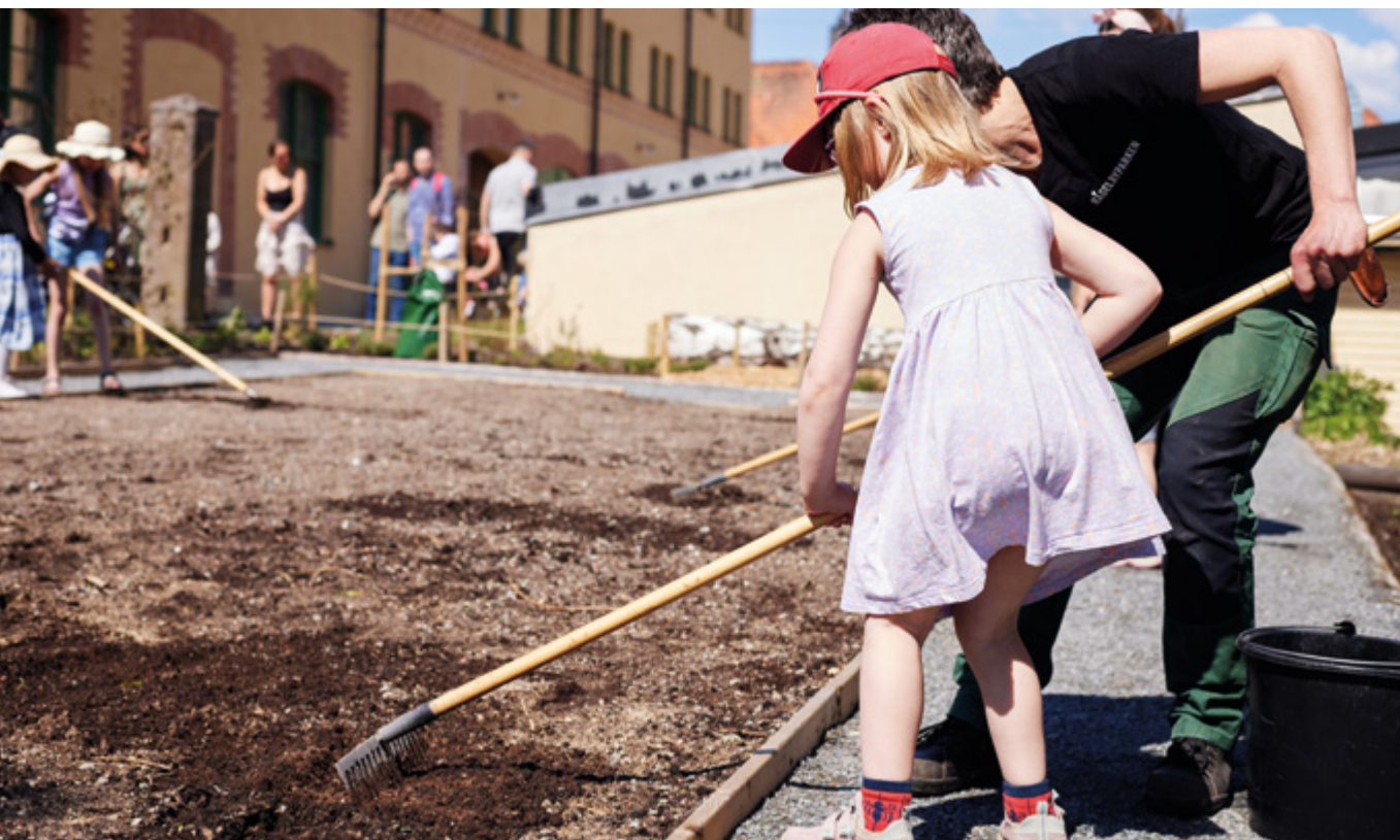
Tillsammans med barnen i parken sådde vi en blomsteräng i samband med invigningen av Småkrypens trädgård.