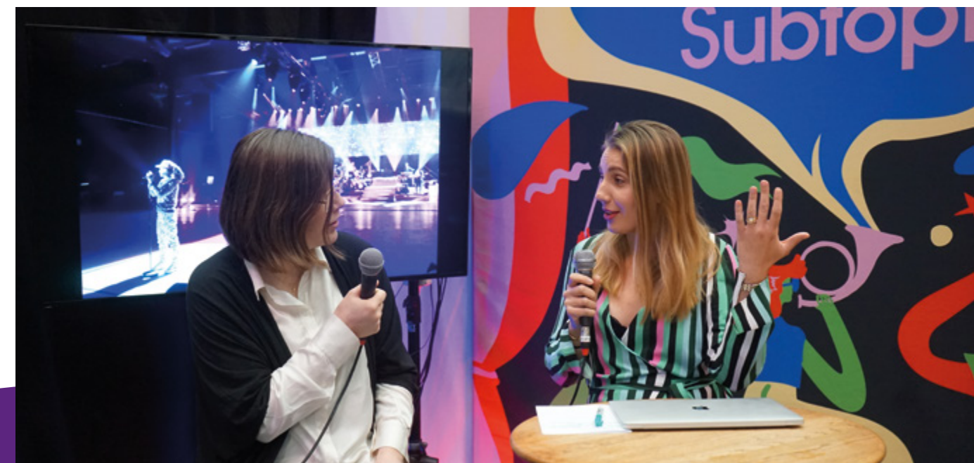
Subtopia hade två föreläsningar och monter under det kulturpolitiska konventet Folk och Kultur.