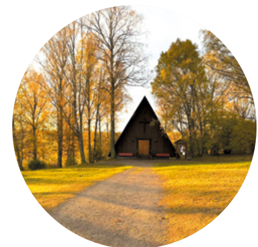
Lida idrottskyrka i sin tjugiga höstlook.