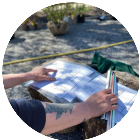
Ritning över Småkrypens trädgård.

fram resultera i att vi kan minska eller helt utesluta inköp av jord, på så vis sparar vi på planetära resurser.