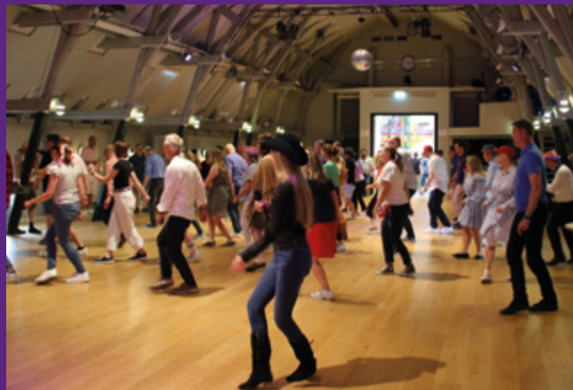
Konferens i hela Subtopias huvudbyggnad med amerikanskt tema.