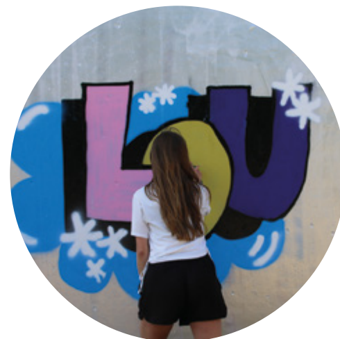
Graffitiworkshop vid Subtopias lilla graffitivägg.

Under året har fokus varit att arbeta så hållbart som möjligt, i alla våra uppdrag. En höjdpunkt var när ungdomarna deltog i projektet "Håll Sverige