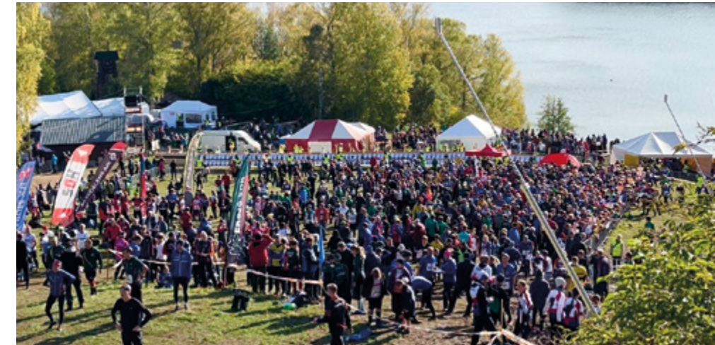
Över 15 000 deltagare under 25manna.