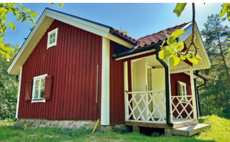
Björknäs Torp har huserat flera tillfällen under året.

Uthyrningen har gett många nöjda besökare.