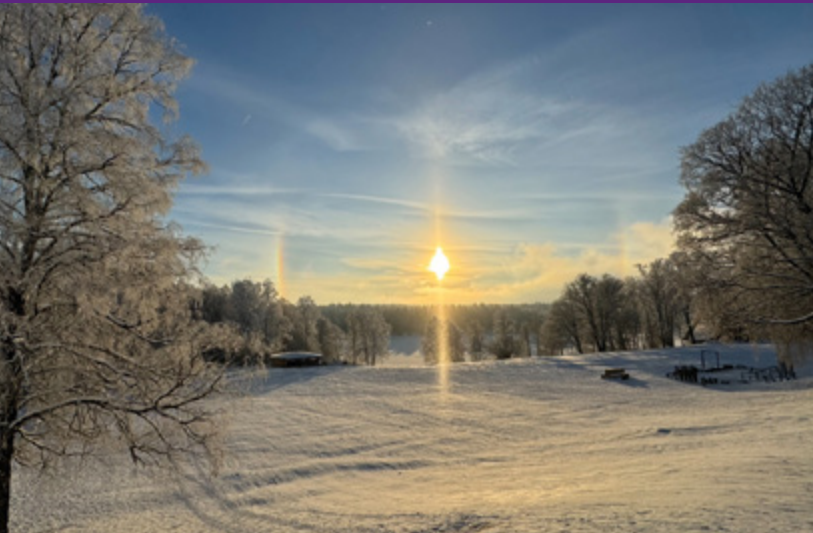
Vintersolen lyser inbjudande över pulkabacken.