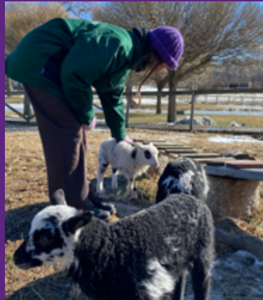
Klapphage med lammen hos Hågelby 4H.