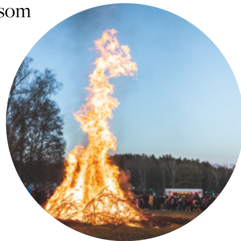
Många samlades runt brasan medan kören sjöng. Foto: Anna Jarlhäll

Nöjda och neutrala besökare (Källa: Lidas besökspanel)