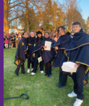
Do It Together kören är en del av Subtopias ungdomsverksamhet.