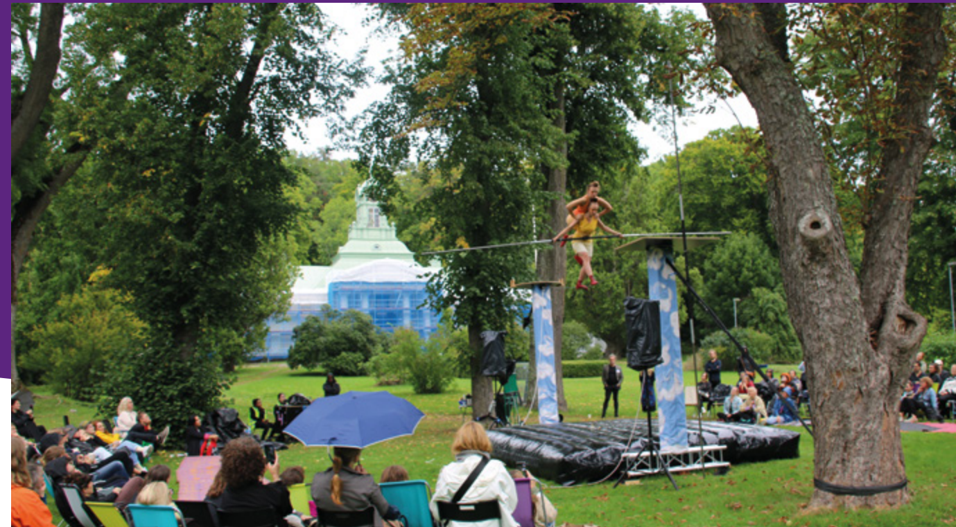
Cirkusföreställning i Alby Gårds park under Inspirationsdag cirkus, arrangerat av Subtopia och Stockholms Region.

Därutöver har personalen gått utbildningar anpassade efter fortbildningsbehovet inom tjänsten.