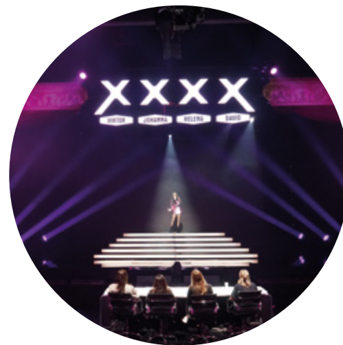
Repetition inför finalen av talang i Hangaren.

Kulturaktiviteter av och för barn och unga i Botkyrka